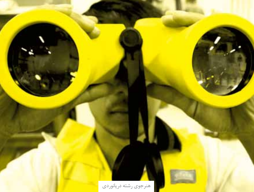
هنرجوی رشته دریانوردی