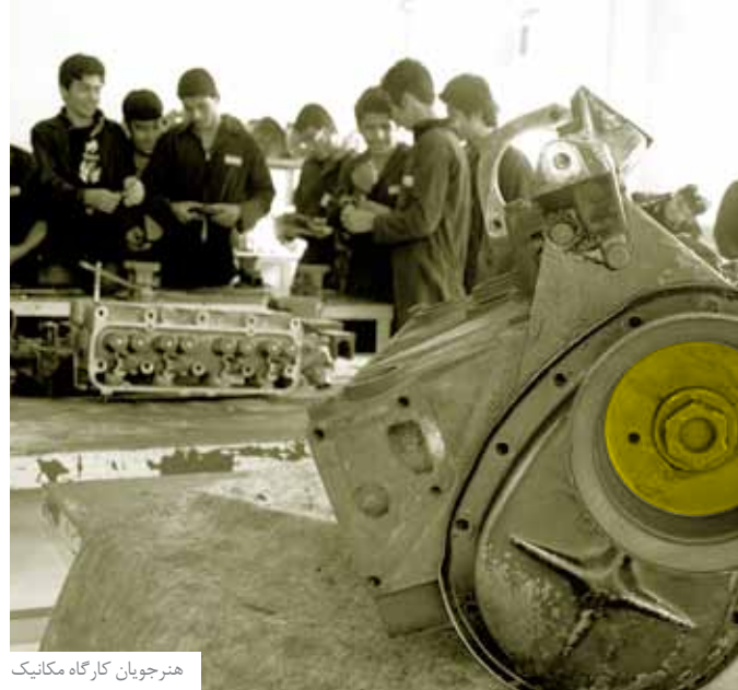
هنرجویان کارگاه مکانیک

او که سال‌های آخر خدمت خود را می‌گذراند، برای مدتی مدیریت هنرستان را بر عهده داشت و امروز هم سرپرستی کارگاه‌های رشته صنایع فلزی و جوشکاری بر عهده اوست. جا دارد در پایان از زحمات وی نیز قدردانی و سپاس‌گزاری کرد.