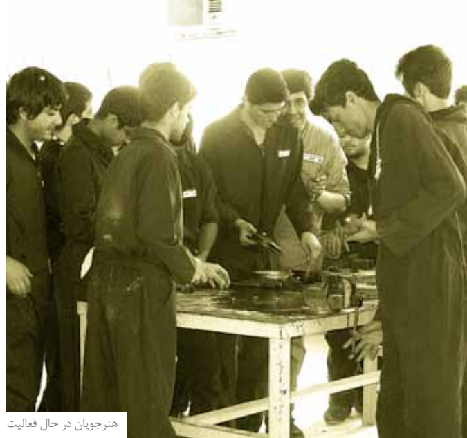
هنرجویان در حال فعالیت

و حتی بدون تحصیلات عالی می‌توانند مشغول کار شوند. البته زمینه ادامه تحصیل برای دانش‌آموزان این رشته تا بالاترین سطح علمی هم فراهم است. هم‌اکنون بسیاری از فارغ‌التحصیلان این رشته در مراکز آموزش عالی مشغول به تحصیل‌اند و تعدادی نیز فارغ‌التحصیل شده‌اند و در شرکت‌ها و سازمان‌های دولتی مشغول کار هستند.