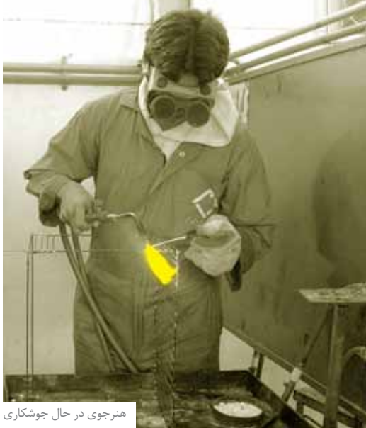
هنرجوی در حال جوشکاری