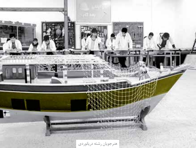
هنرجویان رشته دریانوردی