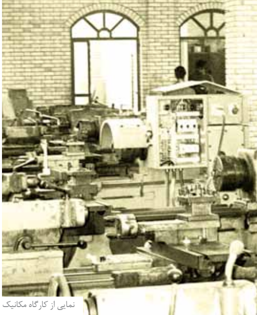
نمایی از کارگاه مکانیک