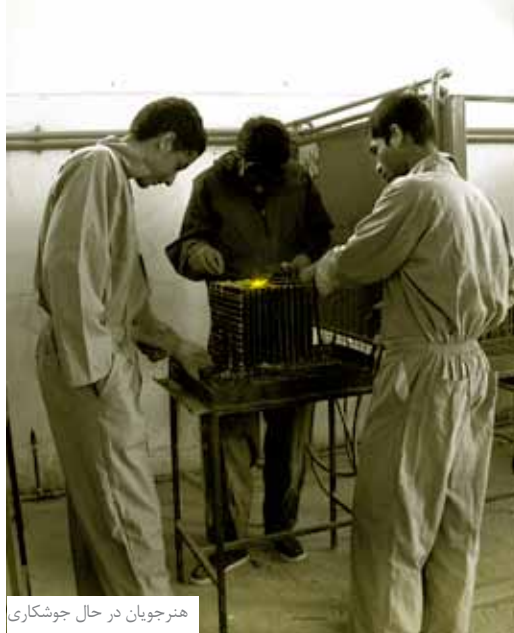
هنرجویان در حال جوشکاری

خستگی‌ناپذیرمان را در این هنرستان سرپا نگه داشته، عشق به جامعه فرهنگی کشورمان است که تا به امروز به یاری خداوند منان و دلسوزان واقعی توانسته‌ایم این هنرستان را زنده نگه داریم.»