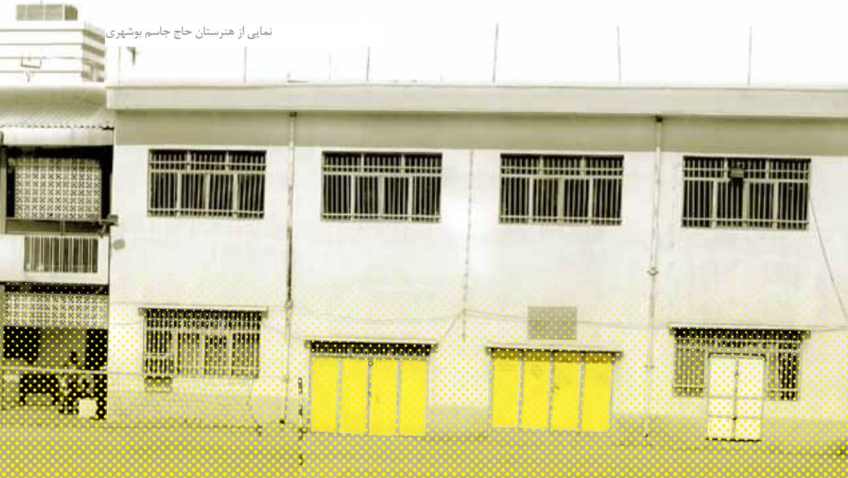
نمایی از هنرستان حاج جاسم بوشهری

در سال ۱۳۴۲ ه.ش فرد خیری به‌نام حاج جاسم بوشهری که علاقه فراوانی به فرهنگ، عمران و آبادی و صنعتی شدن شهر بوشهر داشت تصمیم گرفت به پیشرفت و ترقی نوجوانان و جوانان این خطه محروم از طریق هنرآموزی باری رساند. وی از همان دوران درصدد بنا کردن آموزشگاهی فنی و مجهز به تجهیزات صنعتی و کارگاهی برای استفاده نوجوانانی که به مشاغل فنی و حرفه‌ای علاقه داشتند برآمد. بر این اساس با اهدای یک قطعه زمین و بنا کردن ساختمانی در آن، رسماً آموزشگاهی حرفه‌ای را تأسیس کرد. هنرستان نخست با دو رشته تراشکاری و نجاری و تعدادی هنرجو و کادر اداری آموزشی آغاز به کار کرد و در ادامه رشته‌های ساختمان، برق، فلزکاری، ساخت و تولید، صنایع فلزی و اتومکانیک و... نیز به رشته‌های آن افزوده شد و امروزه حتی رشته‌های ناوبری و موتورهای دریایی را آموزش می‌دهد. این آموزشگاه تا اوایل انقلاب اسلامی به‌صورت شبانه‌روزی اداره می‌شد و هنرجویان از نقاط گوناگون استان به این هنرستان می‌آمدند. ولی امروزه دیگر شبانه‌روزی نیست. در آن زمان بخش اعظم مخارج مدرسه و تجهیزات سرمایه‌ای، کارگاهی و آزمایشگاهی آن را خود حاج جاسم تأمین می‌کرد و در اختیار آموزش و پرورش